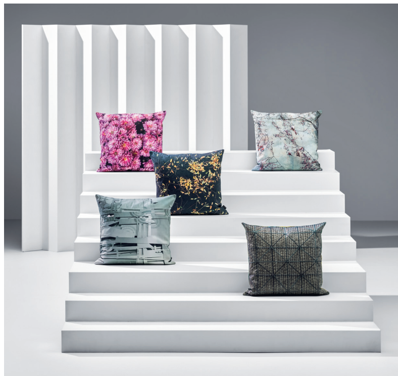
Coussin décoratif ARCONCIEL , 49.90, coton, 50 × 50 cm