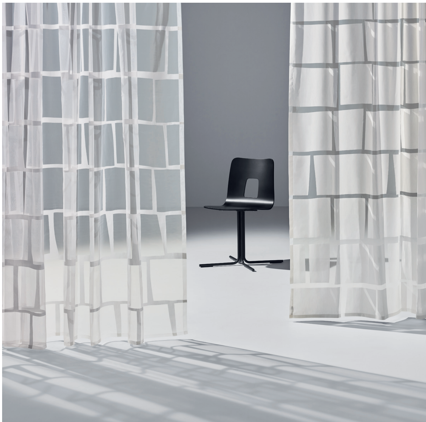
Rideau WISEN . 79.-/m, 60% viscose et 40% polyester, 285 cm